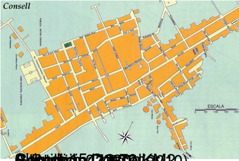
Suplement 5057 (2012)